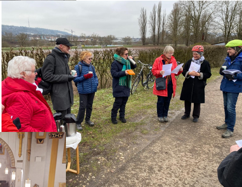
Statio am Biewerer Sportplatz