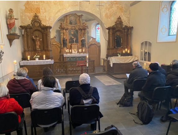
Betstunde in der St. Jost Kapelle