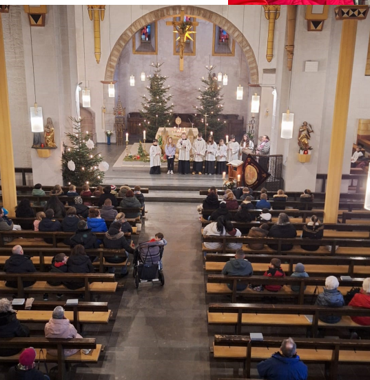
Betstunde der Kommunionkinder In der Pfälzeler Kirche